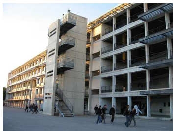
Bat A lycée Mermoz