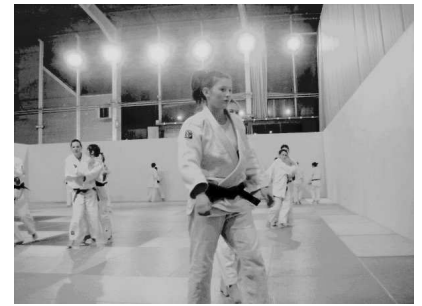
Dojo du Gymnase Ferrari la Rauze