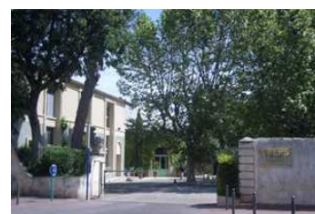
Entrée du CREPS