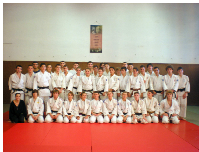
Section scolaire 2009/2010