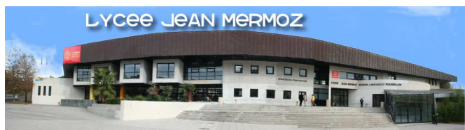
Entrée principale du Lycée