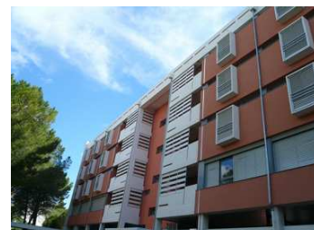
Internat du Lycée Mermoz