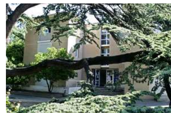
Internat du CREPS