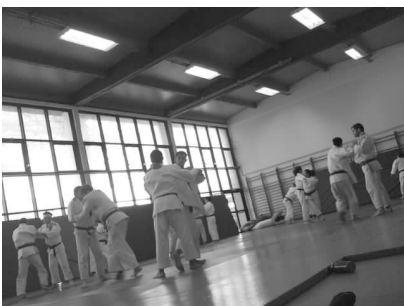
Dojo du Lycée Mermoz

2 médaillés aux Championnats d'Europe Cadets