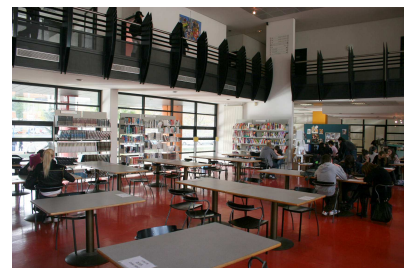
Salle d'étude du CDI (lycée Mermoz)